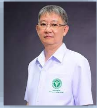
นพ.โอภาส การย์กวินพงศ์ ปลัดกระทรวงสาธารณสุข ที่ปรึกษา คกก.อำนวยการฯ