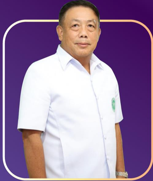
โดย นายแพทย์เกียรติภูมิ วงศ์รจิต ปลัดกระทรวงสาธารณสุข